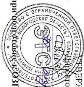
График отключения источников тепловой энергии при подготовке к отопительному сезону на летний период 2018 года.